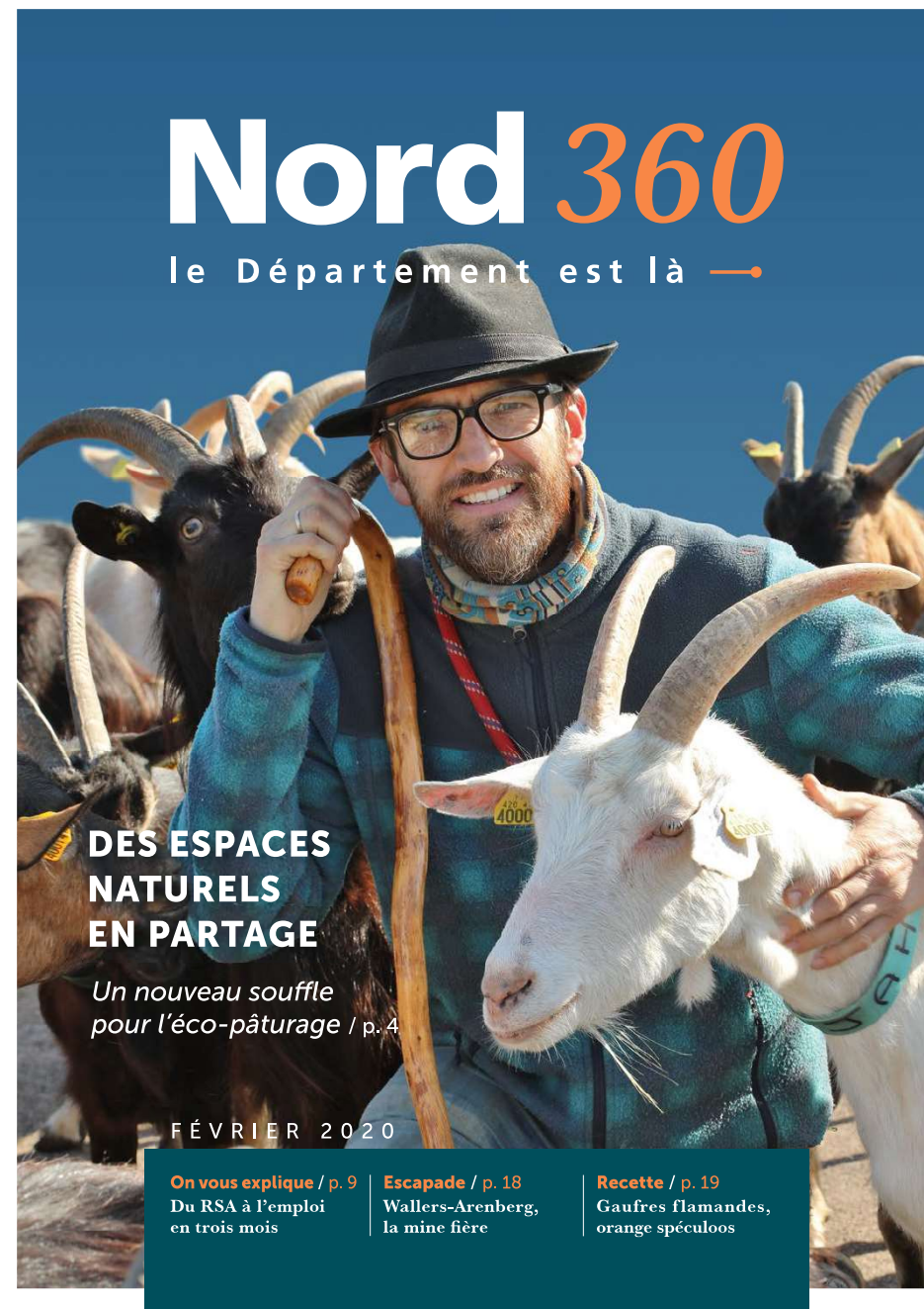
Magazine du Département du Nord